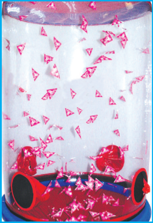
エア-で舞う抽選くじ